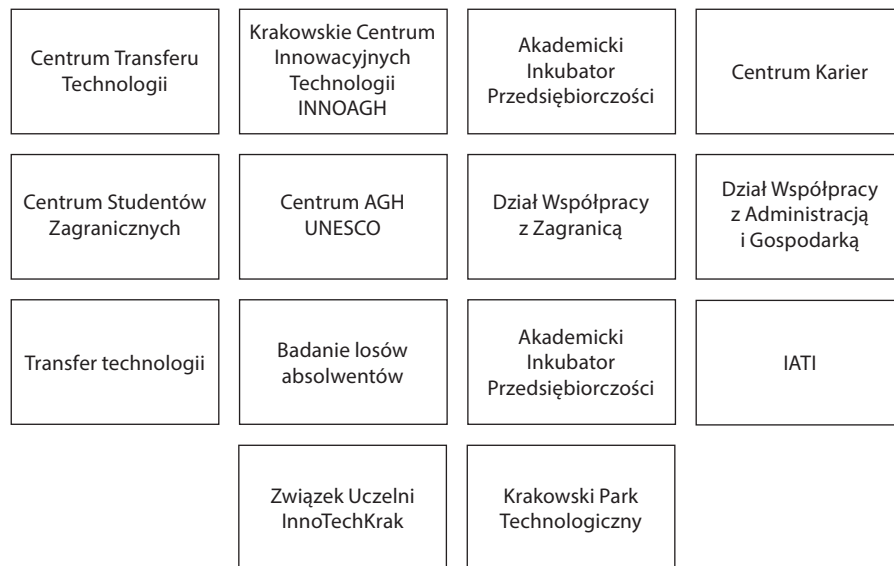
Rysunek 1. Ekonomiczne aspekty społecznej odpowiedzialności AGH

jący społeczną odpowiedzialność w aspekcie ekonomicznym przedstawiono na rysunku 1.